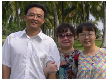
张牧师和师母，女儿合影